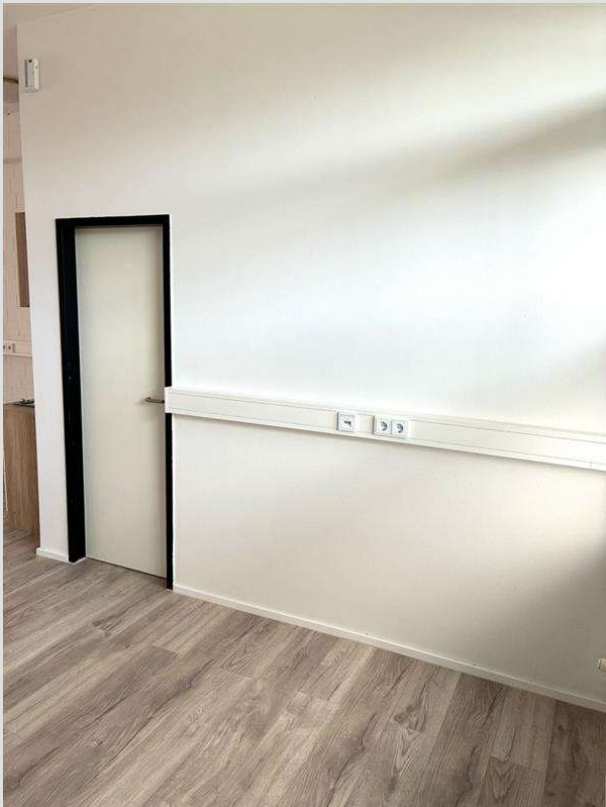
Tür zur Sanitäranlage