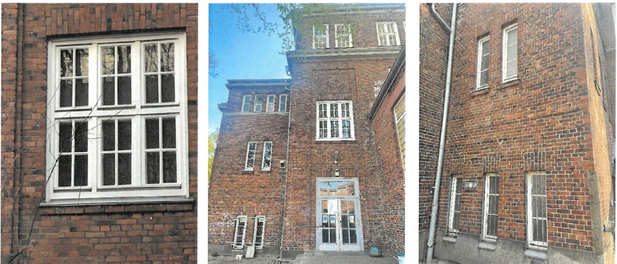
Pos. 04.1 + 04.2 Überholungsbeschichtung, Außentüre profiliert mit Rahmen, innen + außen