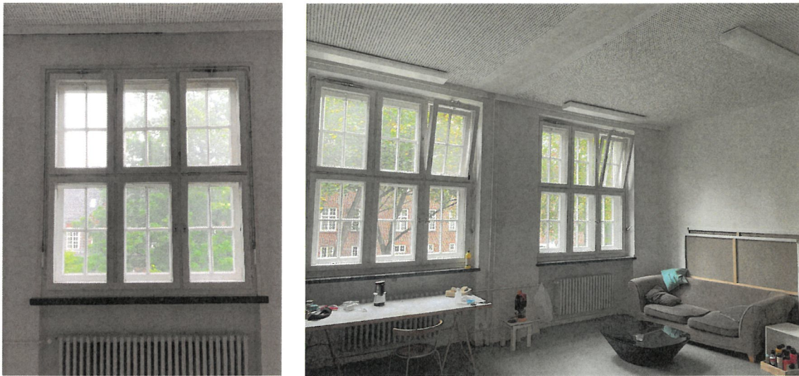
Pos. 03.2 Überholungs-Beschichtung, Außenfenster, Sprossen