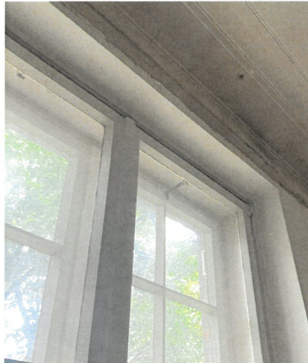
Pos. 02.23 Laibung in Kastenfenster